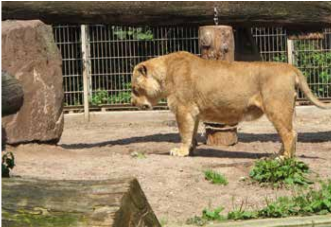
a Der Löwenkater Josef (1996–2015) zeigt eine hochintensive Beißdrohung gegen seinen Bruder Tscha-Tscha (links außerhalb des Bildausschnitts). Um Spannungen zwischen den Katern zu mindern, hatte man sie kastriert. Für eine Erhaltungszucht kamen sie als asiatisch-afrikanische Hybridlöwen ohnehin nicht infrage. Die Kastration führt bei Löwen nach etwa einem halben Jahr zum Ausfall der Mähne.