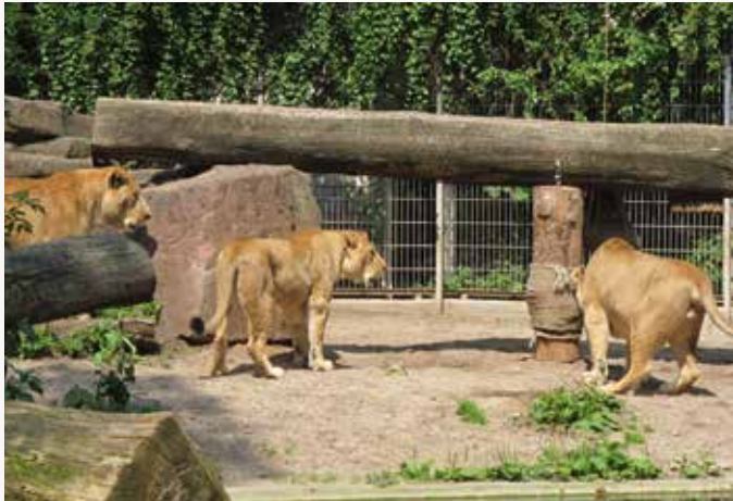
c Sie fixiert den dominanten Kater, nämlich Josef. Dieser knickt mit der Hinterhand ein und wendet den Blick ab. Die Angriffsdrohung ist damit beendet.