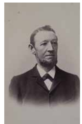
1 Carl Hagenbeck (1844–1913)

Großkatzen sind ziemlich gut darin, zu beobachten und sich in die Umweltblase anderer Tiere einzuschleichen. Wenn diese großen und auffälligen Krallenträger ein sehr viel ausdauerndes und auf der Langstrecke auch schnell-